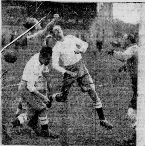
Dänische Fussballer spielten in Berlin; ihre Gegner, die Tennis-Borussen, siegten mit 5:2

Zwei Reichsbannerleute in Hamburg getötet Neue Konfliktgefahr in China - „Italia“ in Kingsbay