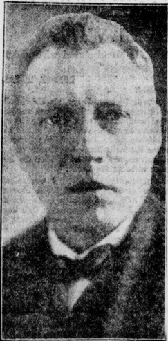
Der totesagte Filchner lebt Der bekannte Tibet-Forscher ist in Indien angekommen