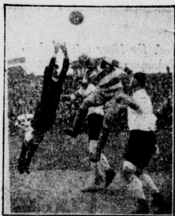
Um den Fussball-Pokal Eine Eckballszene vom Tor der Luchsen-waldler (weisses Hemd)

Mit der Entscheidung des Grossen Preises von Paris auf der Bahn in Longchamps erreichte die französische Galopprennsaison ihren Höhepunkt. Das stattliche Feld von 18 Dreijährigen wurde für die über 3000 Meter führende Prüfung aufgegeben. Der Totalisator honorierte den Sieg von Cri de Guerre mit zwölffachem Gelde. Eine schwere Enttäuschung bereitete Flamingo selbst zahlreichen Anhängern; der Zweite aus dem englischen Derby endete ebenso wie der französische Derbysieger Le Corregge und die viel gewetteten Motricer und Ivanoec im geschlagenen Felde.