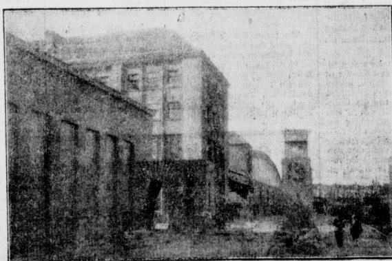
Der neue Betriebsbahnhof der Aboag in Treptow geht seiner Vollendung entgegen