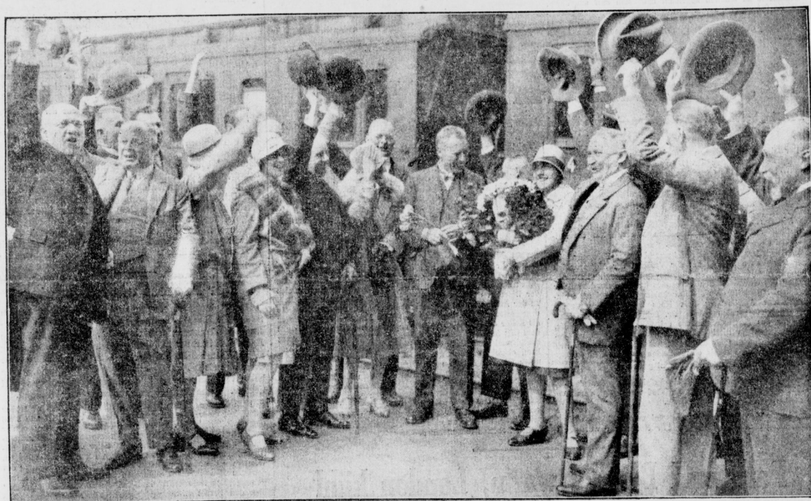
Ein Hoch auf Filchner! — Heute kam der verdienstvolle Südpolar- und Tibetforscher Wilhelm Filchner in Berlin an, ohne dass der wagemutige Pionier von dem offiziellen Deutschland begrüsst wurde

Wirth lehnt ab — Dinghofer-Krise in Wien Kelloggs Echo — Malmgren-Gruppe aufgegeben