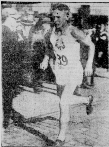
Finne gegen Finne Ritola schlägt Nurmi im 5000-Meter-Lauf