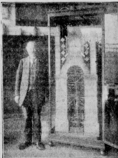
Eine von dem Schuhmacher Wegener mühsam konstruierte Stroh-Uhr wurde auf dem Transport zur Ausstellung beschädigt