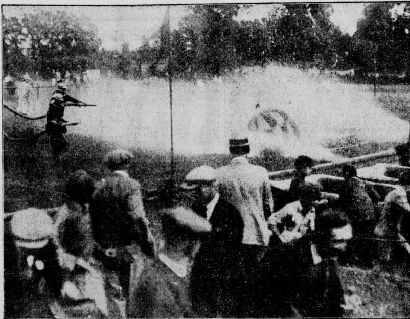
Wasser-Sport der Feuerwehrleute — Ein neues englisches Spiel, bei dem der Riesenball durch den Druck der Wasserstrahlen in das Tor der Gegner getrieben wird