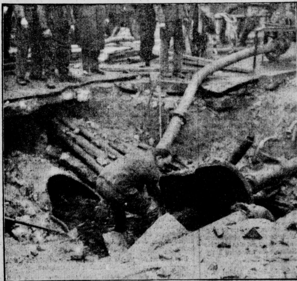
Pumparbeiten beim Wasserrohrbruch in der Köpenicker Strasse unweit der Neanderstrasse