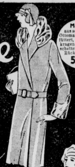
Mantel aus schwerem Ottomane, ganz gefüttert, mit Pelzkrage und -manschetten, moderne Hockpartie 59 90

Wir bringen in dieser Woche wohlfleile Waren aus fast allen Abteilungen, die sich durch ihre Preiswürdigkeit schon jetzt zum Einkauf für das Weihnachtsfest ganz besonders eignen.