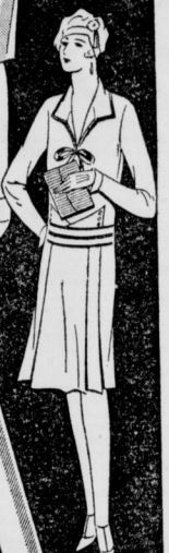
Kleid aus Jerseystoff mit Tricotbesatz am Kragen u. Taille 12 50