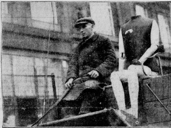
Der lustige Kutscher hat sich eine kopflose Modepuppe als Beifahrer ausgesucht