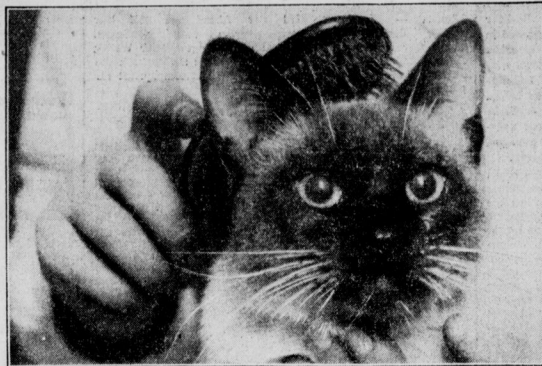
Die Diva wird frisiert

erholte ich mich wieder von dem Schreck. Uebrigens kümmerne ich mich nie wieder um ungelegte Eier; die sollen die Brüder auf dem Rathaus gefälligst alleine ausbrüten. Und wer gibt mir denn schliesslich was für meine Tips? Meine Welt ist des Hauses Herd, auf dem ich jetzt als dankbares Rauchopfer klärechen