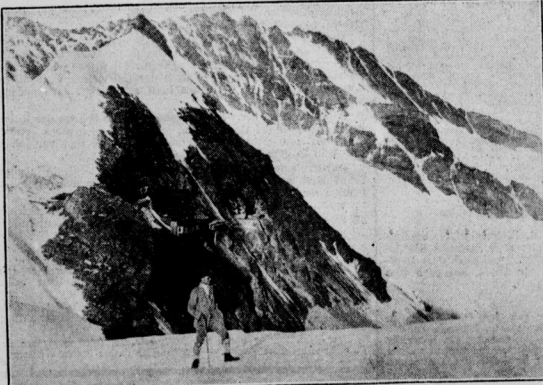
Internationale Forschungsstation in 3500 Meter Höhe

In Dr. Friedrich Stolz feierte am 6. April der Chemiker, dem zum erstmaligen 24. ökonomischen Aufbau eines Hormons gelang, seinen 70. Geburtstag und gleichzeitig sein 40jähriges Dienstjubiläum. Stolz studierte in München Pharmazie und wurde nach bestandem Staatsexamen der Schüler A. von Bayers, 1860 trat er in die Farbwerke Höchst ein, wo er sich zunächst auf dem Gebiete der Antipyrinchenie betätigte, was zur Schaffung des Pyramidons führte. Als man die grosse physiologische Bedeutung des Nebennierenhormons, des Adrenlins, erkannt hatte, war es Stolz, der an die Ermittlung des chemischen Aufbaus ging und dessen Forschergeschick es auch gelang, diesen nicht nur zu ermitteln, sondern diese Substanz künstlich aufzubauen. Damit war die erste chemische Synthese eines Hormons gelungen und seitdem hat sich dieses Produkt unter dem Namen „Suprarenin“ in der Heilkunde bewährt. Der Verein deutscher Chemiker würdigt in der Zeitschrift für angewandte Chemie die Leistungen Dr. Stolz'. Forschung und Wirken von Männern der Technik treten nach aussen selten in Erscheinung. Nur überragende Fähigkeiten und glückliche Begleitumstände vermögen die Industriemauern zu durchbrechen und auch den Aussergewöhnlichen aufzudecken lassen. Zu diesen Ausnahmefällen gehört das Schaffen von Friedrich Stolz.