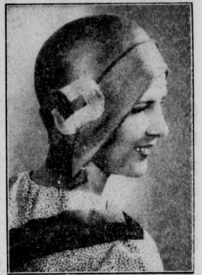
Kleidsame Schute aus Tagalatroh

Abbildung 6 zeigt ein zitronenfarbenes Vollekleid mit einem lose gearbeiteten Capeteil und einem in Falten gelegten Rock. Lita Ney