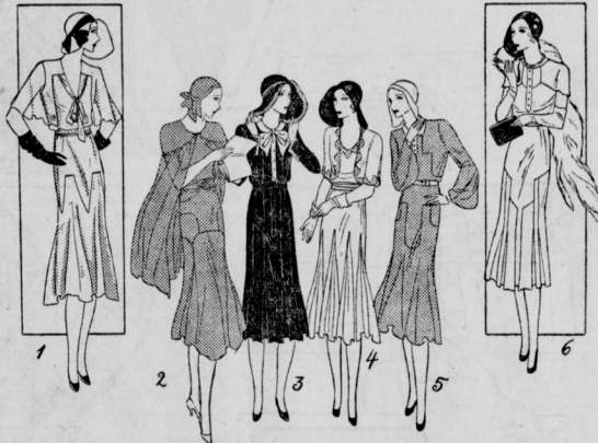
Abbildung 1 ist ein hellbraunes Georgettekleid, das ohne Aermel gearbeitet wird, und

haben. Zu einfarbigen Kleidern wird viel Weiss verarbeitet in Form von Einsätzen und Aufschlägen. Auch Spitzen sind noch immer sehr en vogue, ganze Kleider mit passenden Jäckchen werden aus feiner Spitze hergestellt.