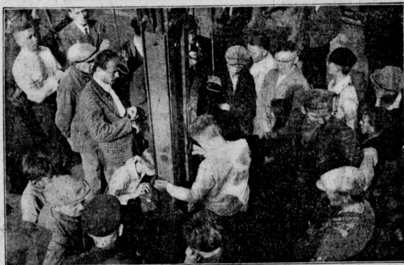
Angehörige warten am Schachtausgang der Wenzeslaus-Grube auf die Bergung der Opfer