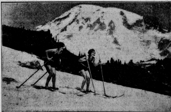
Im Rainier Nationalpark (Nordamerika) kann man auch im Juli Ski laufen