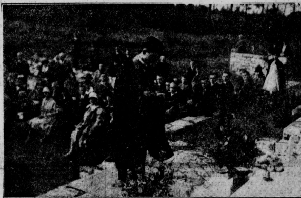
Vor dem Buddha-Tempel wurde ein Gottesdienst für die Gefallenen des Weltkrieges abgehalten