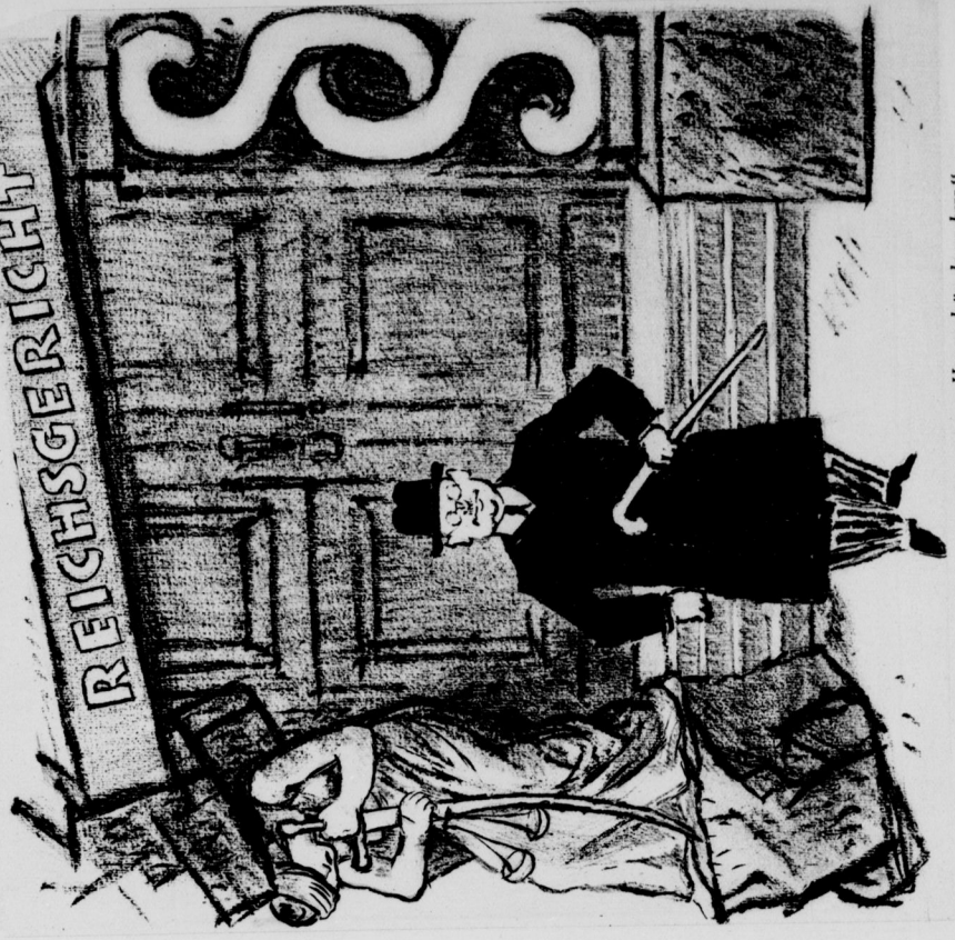
„Es ist doch sehr praktisch, wenn man im eigenen Hause arbeiten lassen kann.“