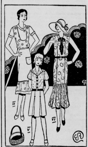
Abbildung 1 zeigt ein praktisches Hauskleid aus blauem oder rosa Waschstoff, mit einem schmalen, ausgebotenen Piquetkragen, vier tief ausgesetzten Falten, die vertikal angeordnet sind.

gestreifte Stoffe kaufen, die sich für solche Gartenkleider gut eignen. Man sieht für den Garten auch oft Modelle mit langen, weiten Hosen. Das sind ausgefallene Sachen, die sich nicht verallgemeinern lassen. Nicht jede Frau kann Hosen tragen, und ein einfaches Waschkleidchen ist in jedem Falle praktischer und immer klidsamer. Mit kleinen Mitteln kann man so ein einfaches Kleid verschönern: kleine, weisse Piquetkragen und Manschetten, die man schnell waschen kann, ein Ledergürtel, ein hübscher, bunter Schlips können Wunder wirken. Zum Schutz gegen die Sonne werden grosse Leinen- oder Strohhüte bei der Gartenarbeit getragen.