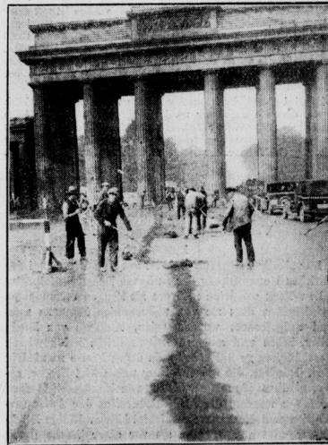
Teer und Basaltsteinsplitt verhindern das Gleiten und Schleudern der Autos