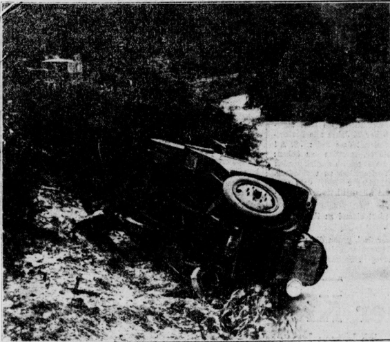
Der Autobus wurde wieder aus der Elbe gezogen

Eine neue Autostrasse durch den Grunewald