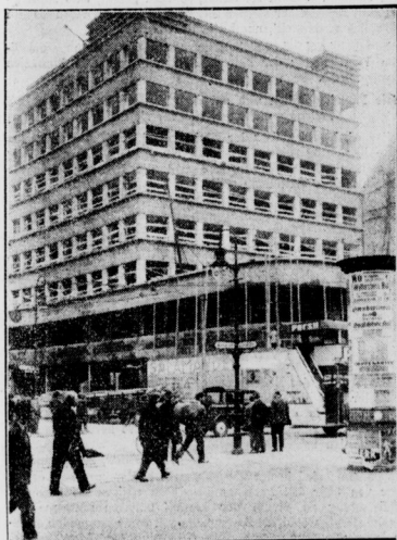
Der Wolkenkratzer gegenüber dem Rathaus vor der Vollendung