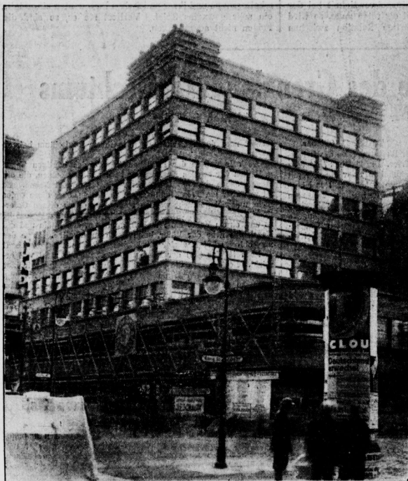
Die Bauten sind in sachlichem Stil gehalten