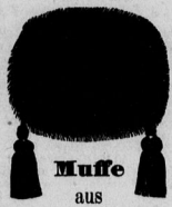
Muffe aus langhaarigem Pelz.

Besonders gefälliges Façon. Jede Muffe mit Seiden- Atlas-Futter.