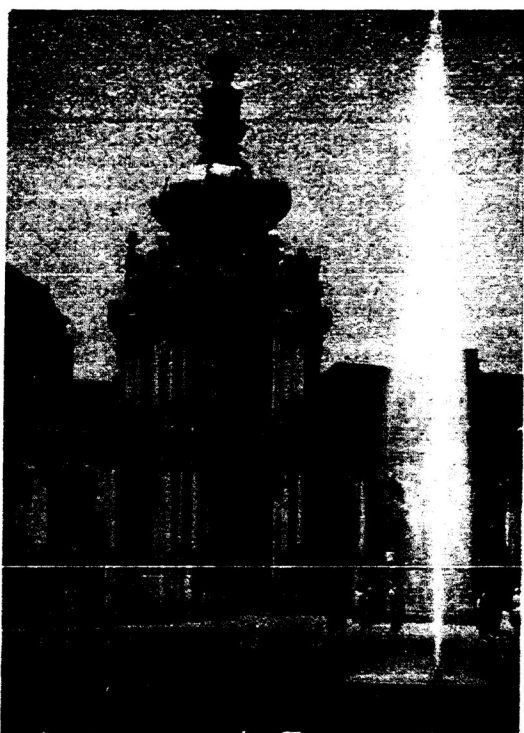
Dresden. Zwinger natur bərkə stilsində arxı. A. D. Pöppelman tərəfindən 1711—1722 nec jıllarda salınqan

Ləkin azatlıq notbıqlar hem kitaplarda jazu belän genə kılmi, anı qoral belän körəşep alırğa kirek. Qılsıç gangestorlarğa çavap birergə ties. Beten denja xucalıqnyñ jırtıqlarına talauqa qarış, Jevropa xalıqnyñ azatlıq eceñ körəşygə irekie berleşiyen qujarğa tieslebez. Əgərdə xəzergə AQS hem Sovetlar Sojuzı çinip çəqsalar, Jevropanıñ jaytırtılmaslıq qarantıqlıq basacaq, jöz menləgən xalıqqa ylem kılacık. Millionlaqan xalıqlar Sovetlar Sojuzına, Tən jaq urmannarğa, Aziə buşlıqlarına, bizgə sazlıqlarına hem Afrika qomıqlarına quılacaq. Beten çir şarınan çibılqan jəhydlər german rəsasın