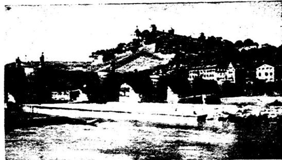
Urtə qasarda təzələn Würzburg şəhərenen kyrenəşə

Spitsiə qultıqında ingliz-amerikalı-ların terror ocqıbc balıq totuc kiməlgə heçym jasadıqan. Ocqıbc zur bieklekten tybəngə təcəp, balıqç-larqə uqəckectən atqan. Bu jərtəq-bəlcə jasadıqan heçym arqasında ber balıqç ylgən. 5 balıqç qatı jaralan-qannər. German soldatların jara-lanqan balıqçılərnə qorş çirgə kiterəp, lazaretqə tapşırqannər.