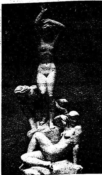
„İrtəngə taq“ Robert Ullmann skulpturası — german sənəqət kyrgəzməşə in zur xəzmatke iş bulıp torə

Kəncəqıx Bosiniənen sənəqət eikəşə bulqan Tusliə şəhərəne kommunist bandalar zur keç çıp heçym jasadıqan vaqıtlarında qanlı juqaltularqə