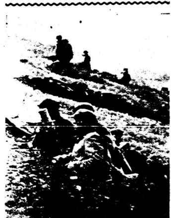
German miniaturlar pozitsiyada

Doşmannın Jevropanın kənbətşbenan kery qurqıyınına qarşı — Atlantik jar bujlarında kecle nıqıtmalar, suqşcan xəzerlektə jaxşı texnik keclərə belən qorallanqan qəskərlər tolar. Əğərdə kirkə bulsa, başqa