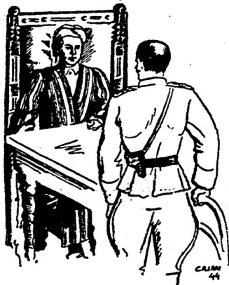
... Mulla aptərap qaldı, ber syz dəşə almadı, anş qurqu bastı

belən bəjləp, bolarnıy həmməsən təbixtaqəbjərm-ajrım təjmələr dip kənə uylşşn. Bolarnıy baş təjməse — bismilləş Tərkiə dip ərşanəşn. Mulla ber syz əjtmədə, polkovnik dəvam itte: — „Həm ul şulaj da: bolqarlar, serblar, cexlar — həmməse bit yzlərenen milli istiqlal tartışularında urş janəna tuplandılar. Annan jərdəm aldılar... Mənə xəzer şul təbixni doşmannar sytep çibərər ecen anş bismilləşn juqatılmaqş bulalar, anş bəjləgən çeben əzəp-əzəp ərçətmaqş, aştındaqş təjmələrə ajrım-ajrım bərər təjmə keçənə genə qəldırmaqş bulalar. Şul çepnə kışyda bismilləşn bəterep ərçətudaqş in auz jəknə bezzə jəklilər. Mənə bez bygen irtəgə qarşbzdaqş terek