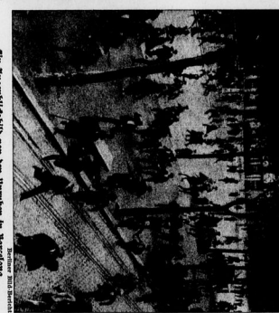
Ein Tag der Jugend

Die Götter der Welt. Die Götter sind in einer großen Halle versammelt und nehmen an einer Veranstaltung teil. Sie sind in Reihen angeordnet und hören den Redner aufmerksam an.