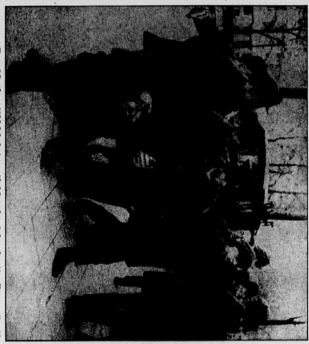
Zwei Stunden Stille für die Toten

Einmaliger Tag der Jugend. Die Jugendlichen sind in Gruppen angeordnet und nehmen an einer Veranstaltung teil. Sie sind mit Uniformen und Ausrüstung ausgestattet und scheinen eine Parade zu führen.