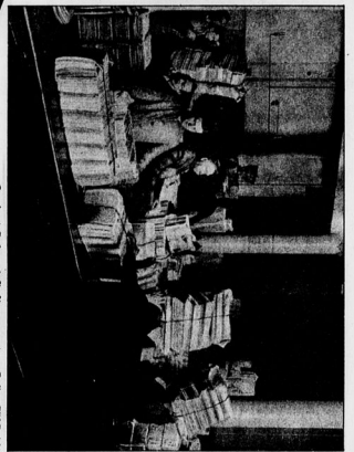
Einmaliger Tag der Jugend

Gelehrte in See-Strömung. Die Gelehrten sind in einem Boot auf dem Meer. Sie sind mit Instrumenten und Ausrüstung ausgestattet und scheinen eine Expedition zu führen. Die See ist ruhig und das Wetter ist schön.