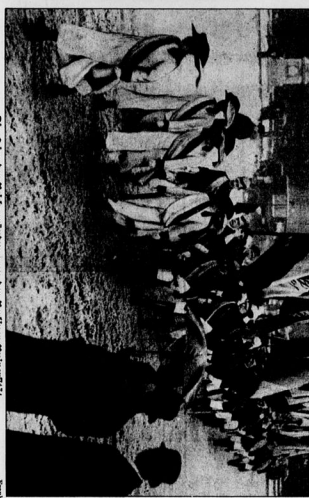
Die Götter der Welt

Zwei Stunden Stille für die Toten. Die Menschen sind in einer großen Halle versammelt und nehmen an einer Gedenkveranstaltung teil. Sie sind in Reihen angeordnet und hören den Redner aufmerksam an.