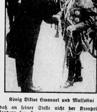
Seine Majestät Kaiser Wilhelm II.

Der Große Rat hat den Verzicht von Falkenhagen auf die Thronfolge abgelehnt. Die Verhandlungen über die Rheinlande sind im Gange. Die Differenzen zwischen Frankreich und England sind zu groß.