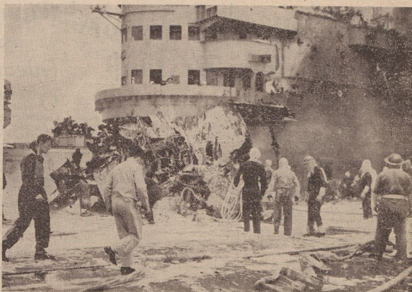
A bord d'un navire porte-avions britannique une équipe déballe les débris d'un "avion-suicide" japonais qui s'est écrasé sur le pont. Les "avions-suicides" ont été constamment employés par le Haut-Commandement japonais lors des opérations navales au large d'Okinawa.

Les élections générales auront lieu en Angleterre, pour la 1ère fois en dix ans, le 5 juillet. Les résultats définitifs ne seront connus que le 26 juillet en raison du dénombrement des suffrages des forces armées qui se trouvent dans toutes les parties du monde.